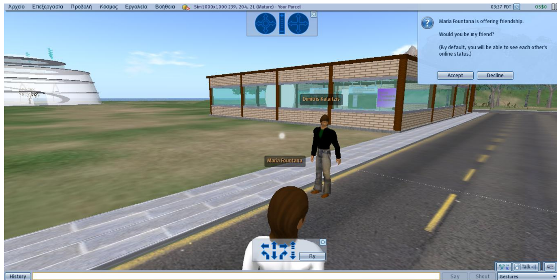
Εικόνα 3: Μπορείς να “δεχτείς” ή να “αρνηθείς” ένα αίτημα φιλίας