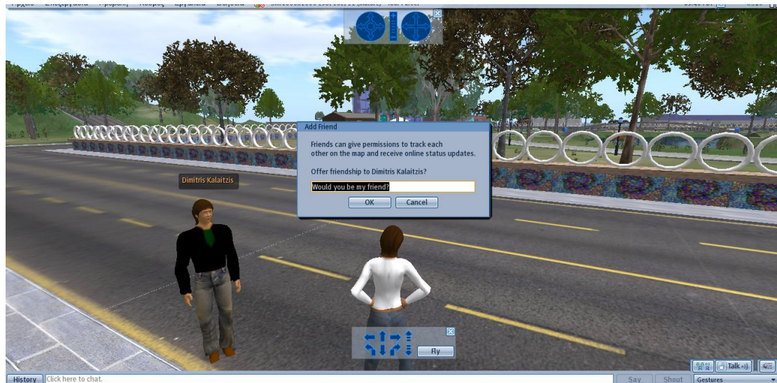
Εικόνα 2: “Would you be my Friend?” και σημαίνει: “Θα γίνεις φίλος μου;”