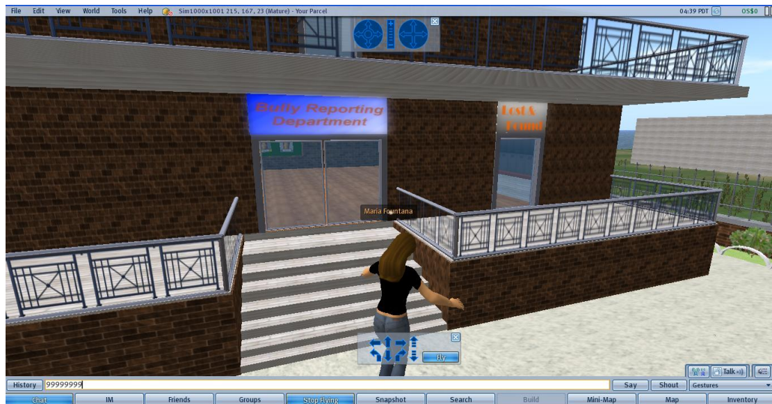
Εικόνα 4: Πήγαινε στο τμήμα απολεσθέντων (Lost and Found)