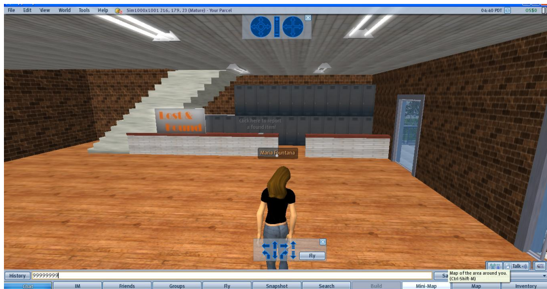
Εικόνα 5: Κάνε κλικ στο βιβλίο επάνω στον πάγκο για να αναφέρεις ένα χαμένο αντικείμενο