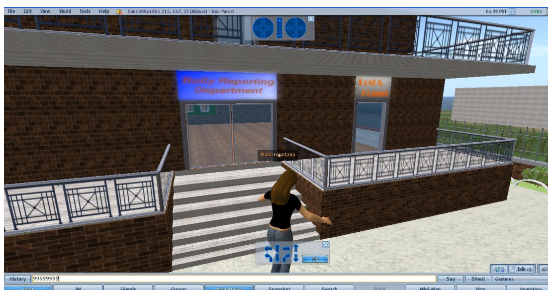
Εικόνα 1: Επισκέψου το Τμήμα Παρενοχλήσεων (Bully Reporting Department)