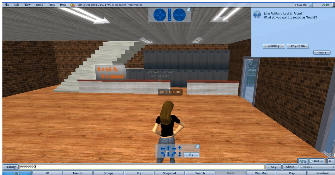
Εικόνα 6: Επίλεξε ποιο αντικείμενο θα ήθελες να παραδώσεις.