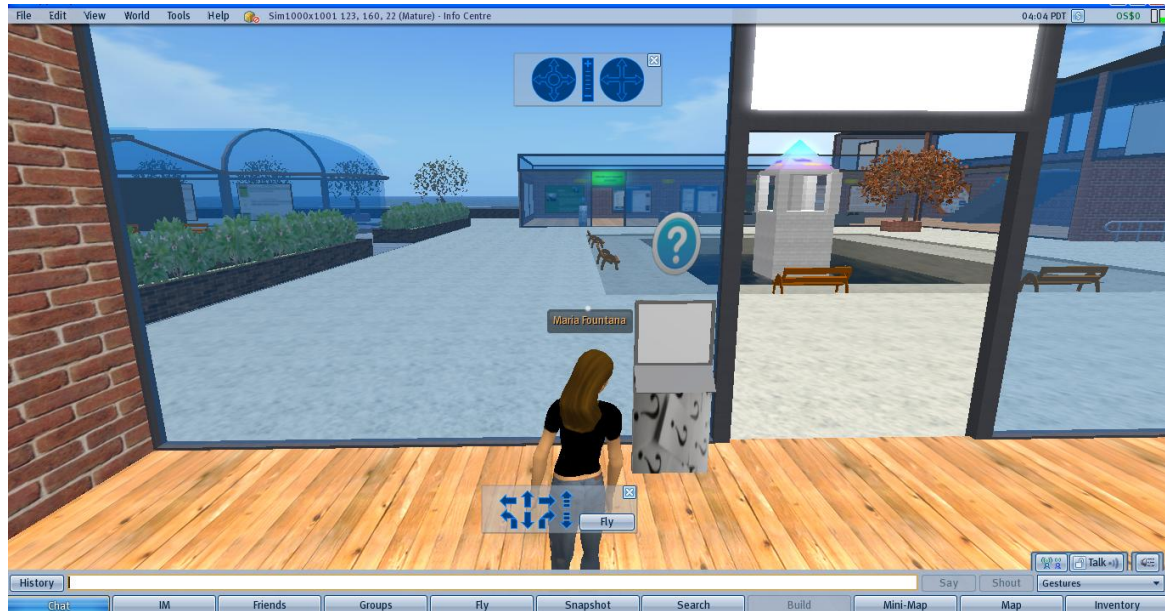
Εικόνα 1: Σημείο Απάντησης των Κουίζ Νο 1 (Quiz Point No1) στο Κέντρο Πληροφόρησης