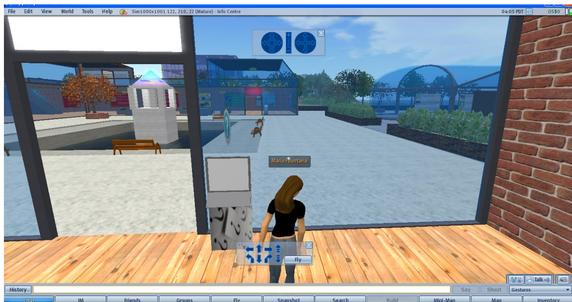
Εικόνα 2: Σημείο Απάντησης των Κουίζ Νο 2 (Quiz Point No2) στο Κέντρο Πληροφόρησης