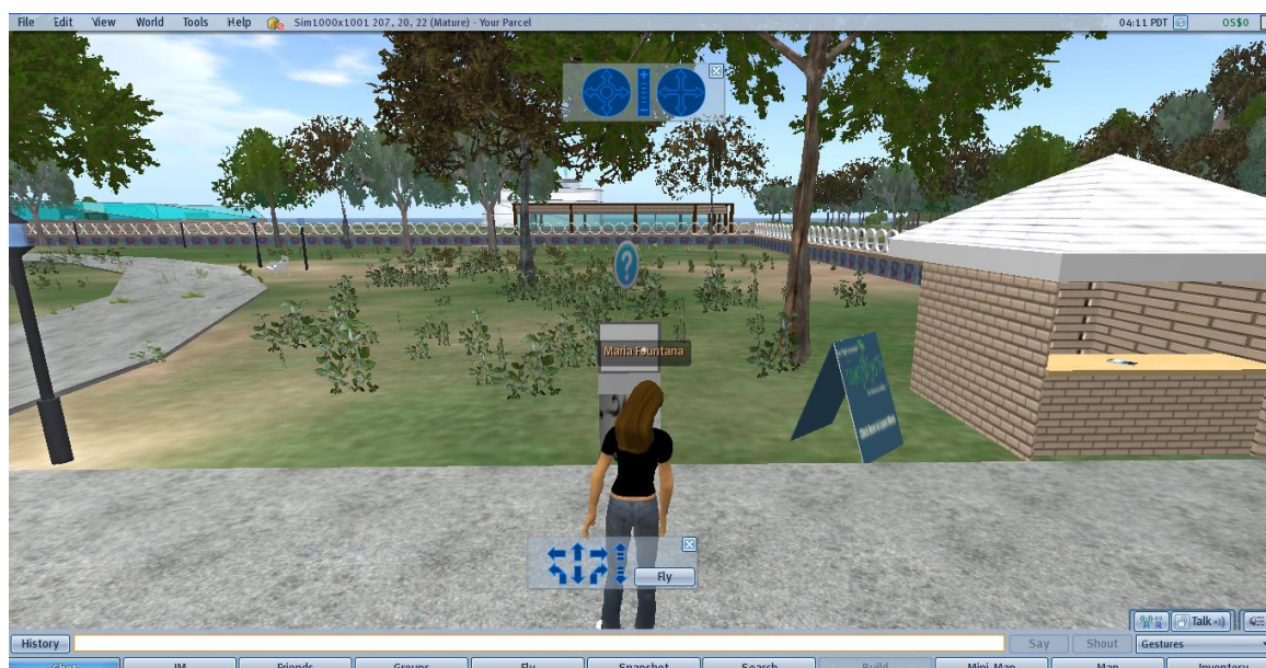
Εικόνα 4: Σημείο Απάντησης των Κουίζ Νο 4 (Quiz Point No4) στο Πάρκο του SimSafety