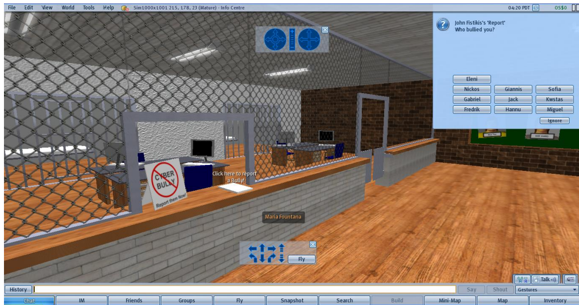
Εικόνα 3: Επίλεξε ποιον θα ήθελες να καταγγείλεις.